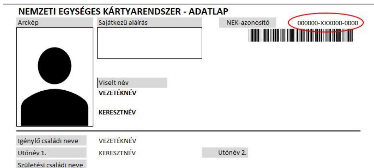
1. ábra - NEK adatlap - NEK azonosító