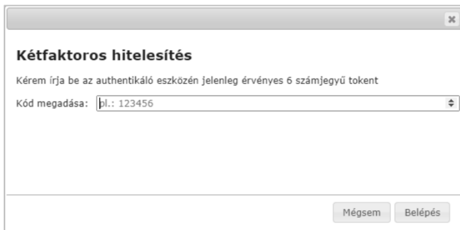
4. ábra – Neptun rendszer – Token kód megadása bejelentkezésnél

Kétfaktoros hitelesítés megszüntetése esetén a Kikapcsolás gombot választva lehetséges a regisztrációt törölni: