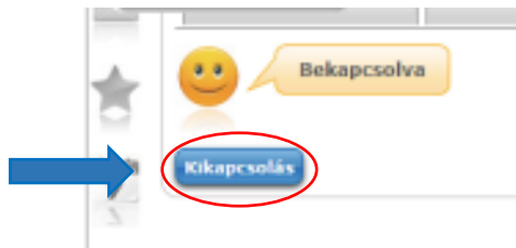
5. ábra – Neptun rendszer – Kétfaktoros hitelesítés kikapcsolása

Kétfaktoros hitelesítés megszüntetése esetén a Kikapcsolás gombot választva lehetséges a regisztrációt törölni: