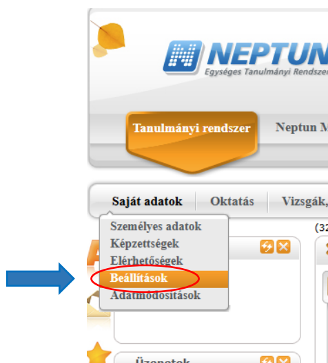
1. ábra – Neptun rendszer – Beállítások megnyitása

Oktatói webes felületen a Saját adatok->Beállítások menüpontban a Kétfaktoros hitelesítés tabulátorfül kiválasztása után, majd a Beállítás gombra kattintva indítható el a regisztráció.